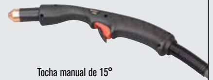
Tocha manual de 15°