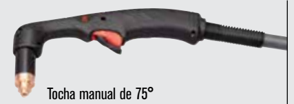
Tocha manual de 75°

(para mais opções de tochas, visite www.hypertherm.com )