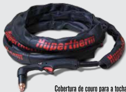
Cobertura de couro para a tocha