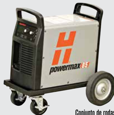
Conjunto de rodas